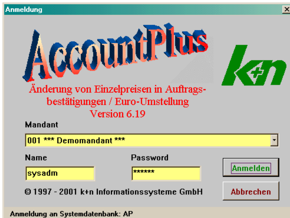
Abbildung 1 Anmeldemaske

Das Programm wird über den externen Windows-Programmaufruf „Ausführen“ mit anschließender Auswahl des AccountPlus-EXE-Verzeichnisses und der Datei ACEPUMST.EXE gestartet. Es erscheint die bekannte AccountPlus-Anmeldemaske, mit der man sich mandantenabhängig an der entsprechenden Datenbank als AccountPlus-Benutzer mit Supervisor-Rechten anmeldet.