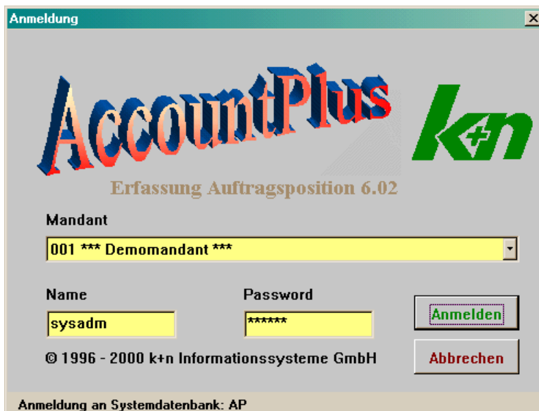
Abbildung 1 Anmeldemaske

Das Programm wird über den externen Windows-Programmaufruf „Ausführen“ mit anschließender Auswahl des AccountPlus-EXE-Verzeichnisses und der Datei APPELNR.EXE gestartet. Es erscheint die bekannte AccountPlus-Anmeldemaske, mit der Sie sich mandantenabhängig an der entsprechenden AccountPlus-Datenbank anmelden.